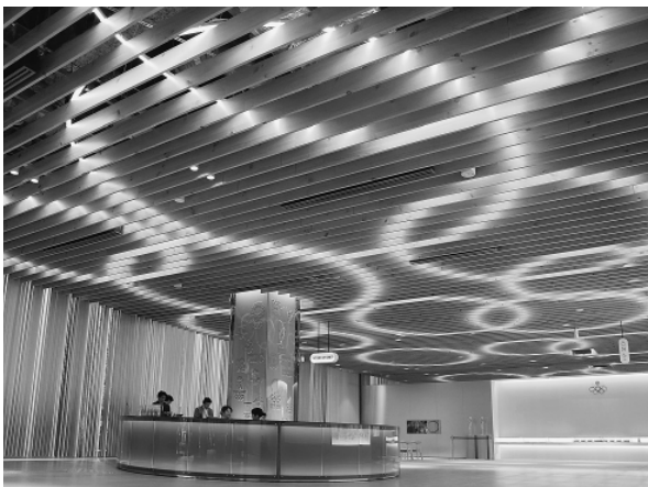
オリンピックミュージアム

この時に最も大切だったことは、この木が育った北海道家庭学校が児童自立支援施設で、毎日の人と物の出入り、出来事が日誌に記録されていたことです。この木の苗をもらい受けた事も記録されていました。木の「出自」が確かであるという事が証明され、この木はミュージアムの内装に使っていただくことが決定します。それは、大会の備品などで使ってすぐに捨ててしまうより、何倍も意義があることです。設計者である知人の理解と協力に本当に感謝しました。